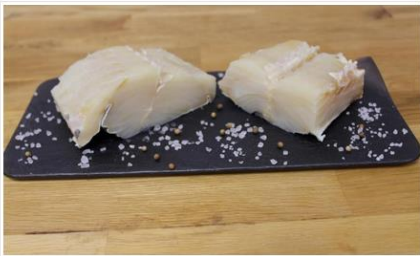
Bacalao desalado.

En el mercado español hay una gran variedad de productos del bacalao , pero el ciudadano desconoce las diferencias, según las industrias españolas, integradas en la patronal Anfaco-Cecopesca que han puesto en marcha una campaña precisamente para informar sobre dichas distinciones.