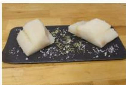
Bacalao al punto de sal.

Es el centro de la campaña del proyecto Saldicomm, impulsada por la Asociación de Fabricantes de Bacalao y Salazones (Anfabasa), asociada a Anfaco, y por el Consejo de Productos del Mar de Noruega. Desde el área de Tecnología de Anfaco, Rodrigo González Reboredo, explica a Efeagro que es habitual un “mal etiquetado” del bacalao, lo que lleva a no distinguir estos dos términos, algo que para el sector es como confundir el “jamón curado” con el “no curado”.