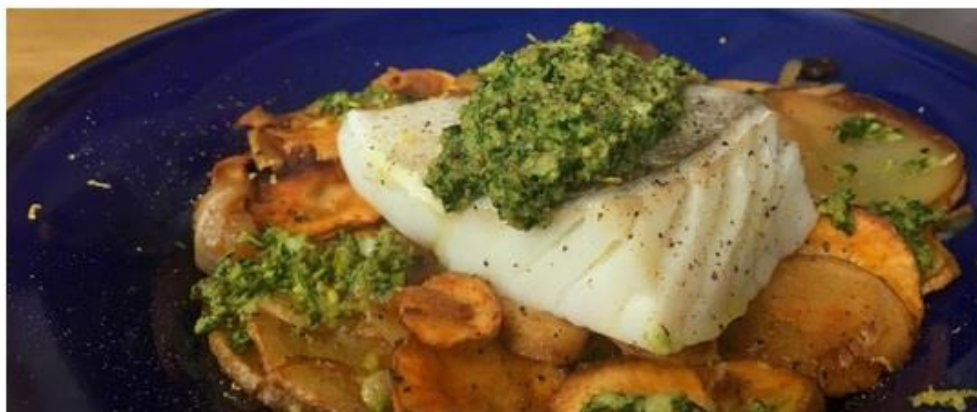
Unas lascas de bacalao cuejan en cualquier receta.

Podemos prepararlo sin pasar por el fuego, siempre que su consistencia sea firme, su olor, agradable y su color, uniforme