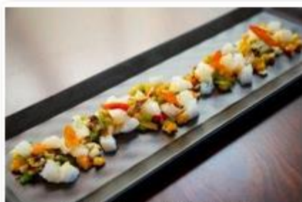
Creación culinaria con bacalao.

Pese a ser un pescado muy tradicional en la cocina nacional, actualmente muy pocos barcos con bandera española se dedican a extraerlo como especie principal. Según el último censo, publicado este año, cuatro buques españoles tienen cuota (de las asociaciones Agarba y Arbac ). Faenan en caladeros del Ártico, del Atlántico norte (NAFO) u otras aguas internacionales.