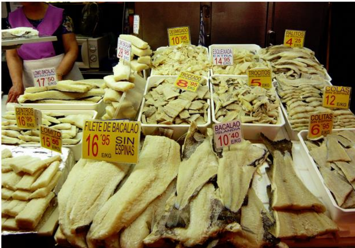
Puesto de venta de bacalao.

Al igual que para otras gamas de productos alimentarios, han aparecido formatos adaptados a los nuevos hábitos de vida; como es el caso del bacalao desalado y el bacalao al punto de sal. Estas dos denominaciones hacen referencia a dos productos que, aunque en apariencia puedan parecer similares, presentan diferencias notables en cuanto a su proceso de elaboración, su aroma, sabor, textura, composición y comportamiento en cocina.