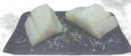
BACALAO "AL PUNTO DE SAL"

España es el tercer país con mayor consumo de bacalao (en volumen) de la UE, por detrás de Reino Unido y Francia, a diferencia de estos en los que predominan el consumo de bacalao no sometido a maduración en sal, nuestro país destaca por la fuerte tradición de las variedades provenientes de la salazón.