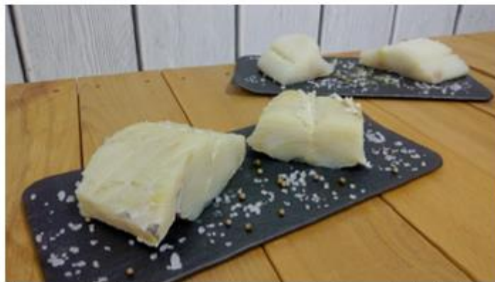
El proyecto de ANFACO informa al consumidor de las diferencias entre bacalao desalado y bacalao al punto de sal.

Anfaco evalúa las posibilidades de la biotecnología azul