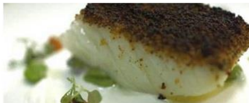
Una pieza de bacalao.

Sin embargo, cuando el producto ha sido cocinado, el mismo consumidor es perfectamente consciente de las diferencias en sabor , aroma y textura entre ambos tipos de bacalao. Esto pone de manifiesto la enorme importancia de que la mención "al punto de sal" o "desalado" acompañe al nombre comercial y sea claramente visible, facilitando una compra consciente por parte del consumidor.